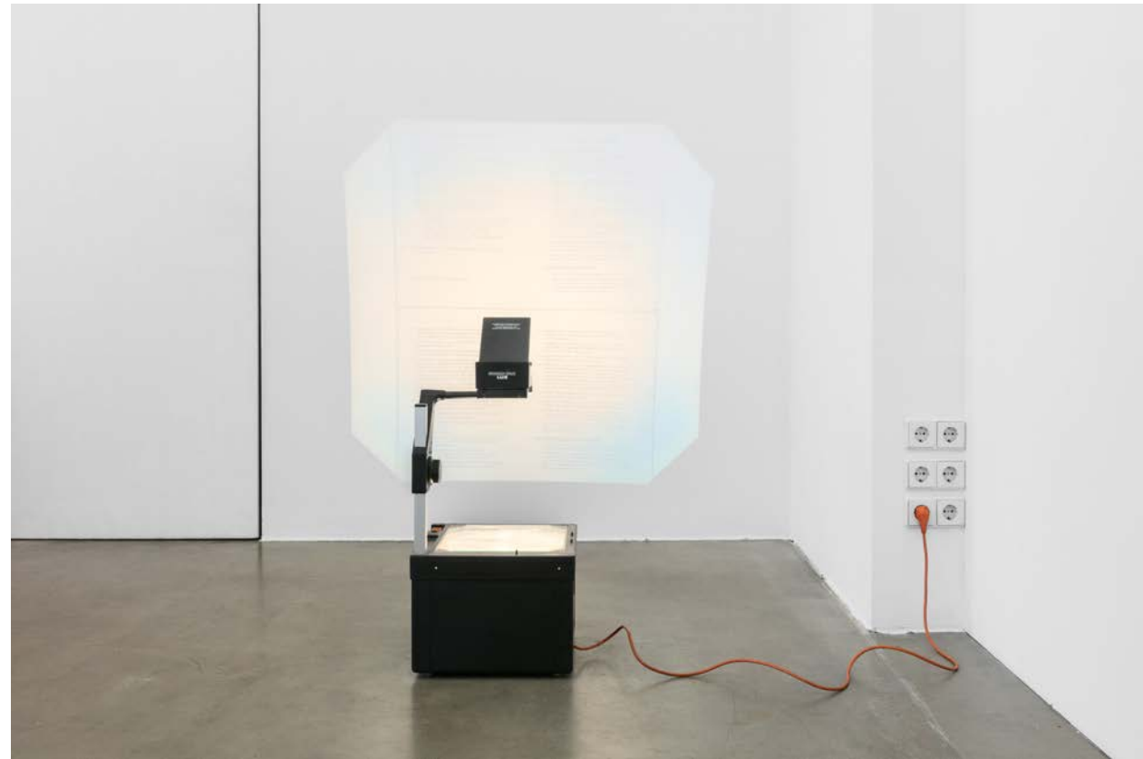
Jonas Höschl MERKBLATT (2024) document from the BKA silkscreen fired in glass + overhead projection