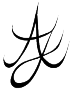
Jonas Höschl Ohne Titel (2023) Frottage 44 x 55 cm (frame)

The frottage of the gravestone of Andreas Baader and Gudrun Ensslin is part of Jonas Höschl's interest in documentary processes. What is the effect of this media change when the simplest of all reproduction technologies makes the names of the terrorists appear a lovers' carving?